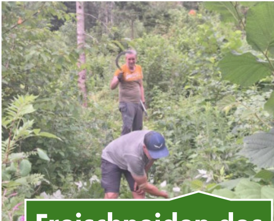
Freischneiden des Wegs