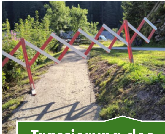
Trassierung des Wegs