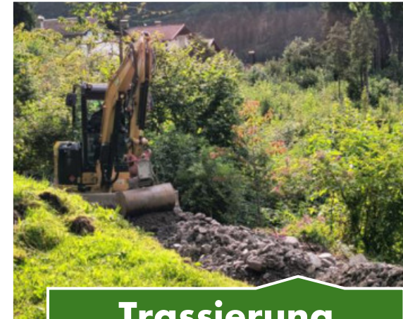
Trassierung des Wegs